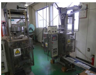
ティーバッグ充填機