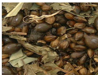
9種ブレンド茶(粉碎前)